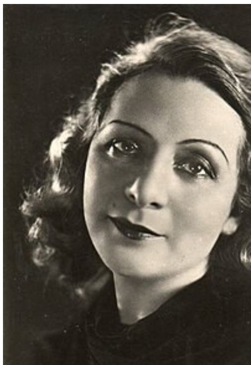
Maria Melato in una fotografia del 1930